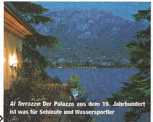
Al Terrazzo: Der Palazzo aus dem 19. Jahrhundert ist was für Sehleute und Wassersportler

Dort, wo der Comer See Lago di Lecco heißt, liegt dieses reizvolle Hotel. Der Blick von der Terrasse über den See ist wirklich einzigartig. Und auch das Restaurant besitzt einen ausgezeichneten Ruf. Zum persönlichen Charme des Palazzo gehören die schattigen Gärten und die dezent eingerichteten Zimmer. Und wenn der See schon so nah ist: Segeln und Wasserski fahren kann man hier auch. Für Sportler mit Sinn für Weitblick.