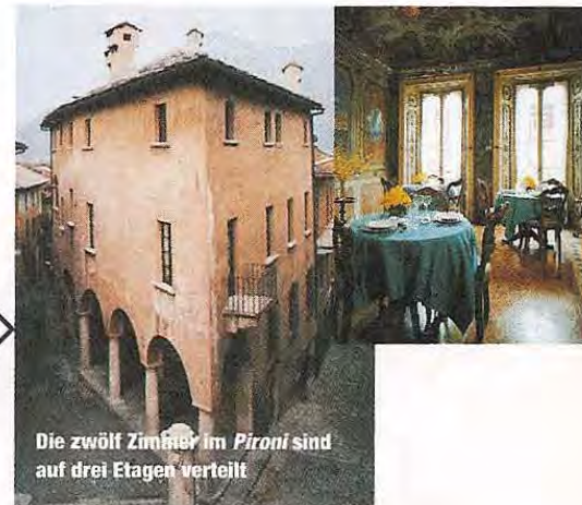
Die zwölf Zimmer im Pironi sind auf drei Etagen verteilt

Ein ehemaliges Kloster aus dem 15. Jahrhundert beherbergt dieses sympathische Hotel der 3-Sterne-Kategorie. Die zwölf Zimmer sind komfortabel, mit rustikalen Möbeln eingerichtet. Es befindet sich im historischen Zentrum von Cannobio, das am Ostufer des Lago Maggiore kurz vor der Schweizer Grenze liegt – top für Ausflüge. Für kulinarische Grenzgänger.