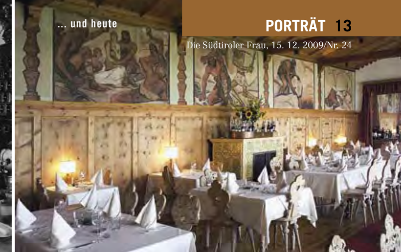
... und heute

des Hauses – ein Verleger – die Idee, die Rezepte in einem Kochbuch zu sammeln und unter dem Titel „Südtiroler Leibgerichte“ zu veröffentlichen. Das erste Kochbuch kam in den 60er Jahren auf den Markt. Es war ein Renner