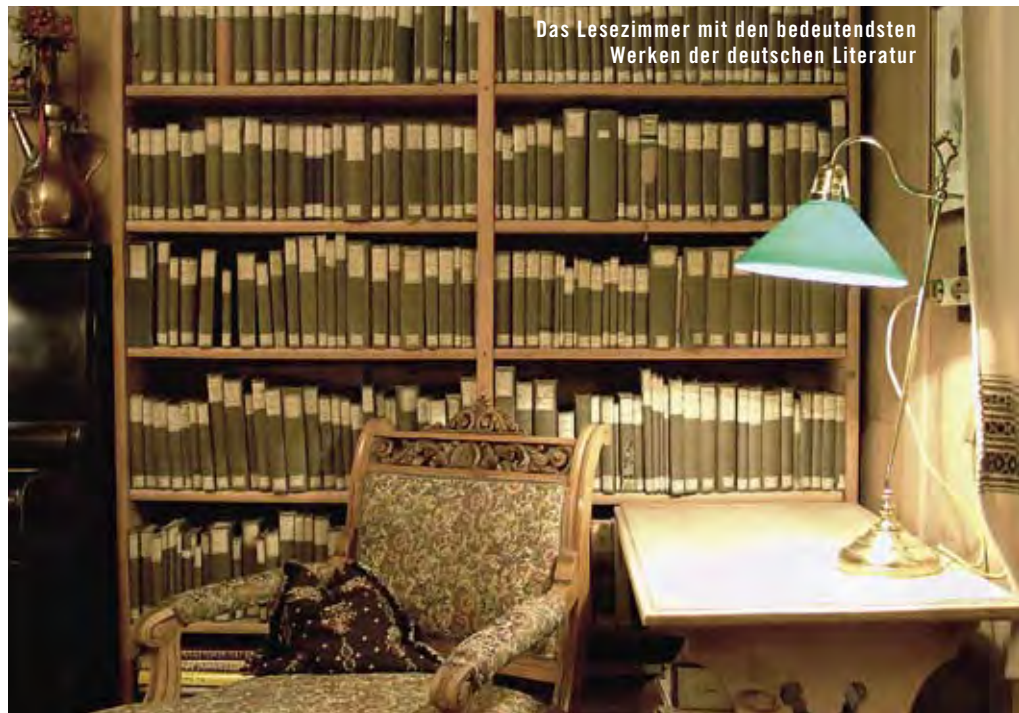
Das Lesezimmer mit den bedeutendsten Werken der deutschen Literatur