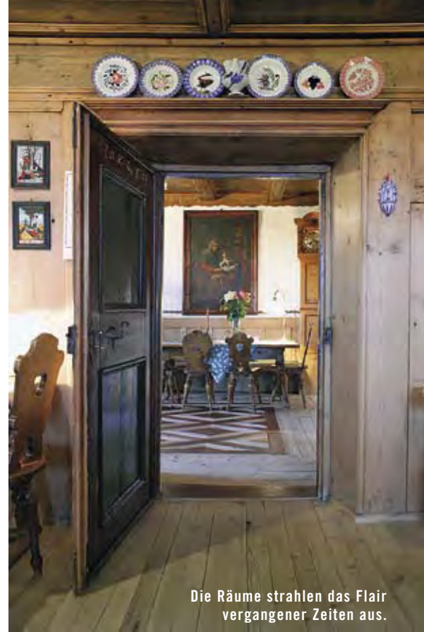
Die Räume strahlen das Flair vergangener Zeiten aus.