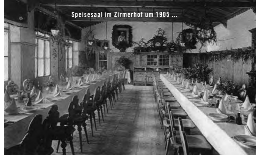
Speisesaal im Zirmerhof um 1905 ...

Erst nach 1924 fanden sich erstmals wieder Gäste ein. Vor allem Persönlichkeiten aus Wissenschaft und Kultur hatten zu jener Zeit genügend Geld und Zeit, um am Zirmerhof die Landschaft, die Ruhe und das gute Essen zu genießen. Bis zu drei Monate verweilten die meisten Gäste in Radein.